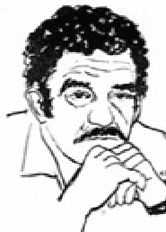
GABRIEL GARCIA MÁRQUEZ